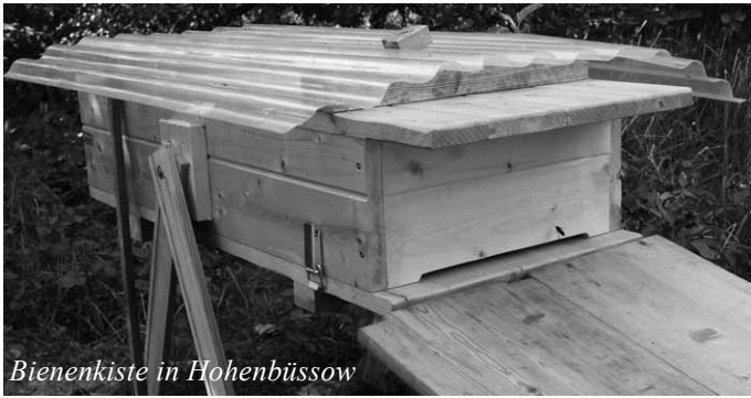
Bienenkiste in Hohenbüssow

Die Bienenkiste ist ein Konzept, um mit verhältnismäßig wenig Aufwand selbst Bienen halten zu können.