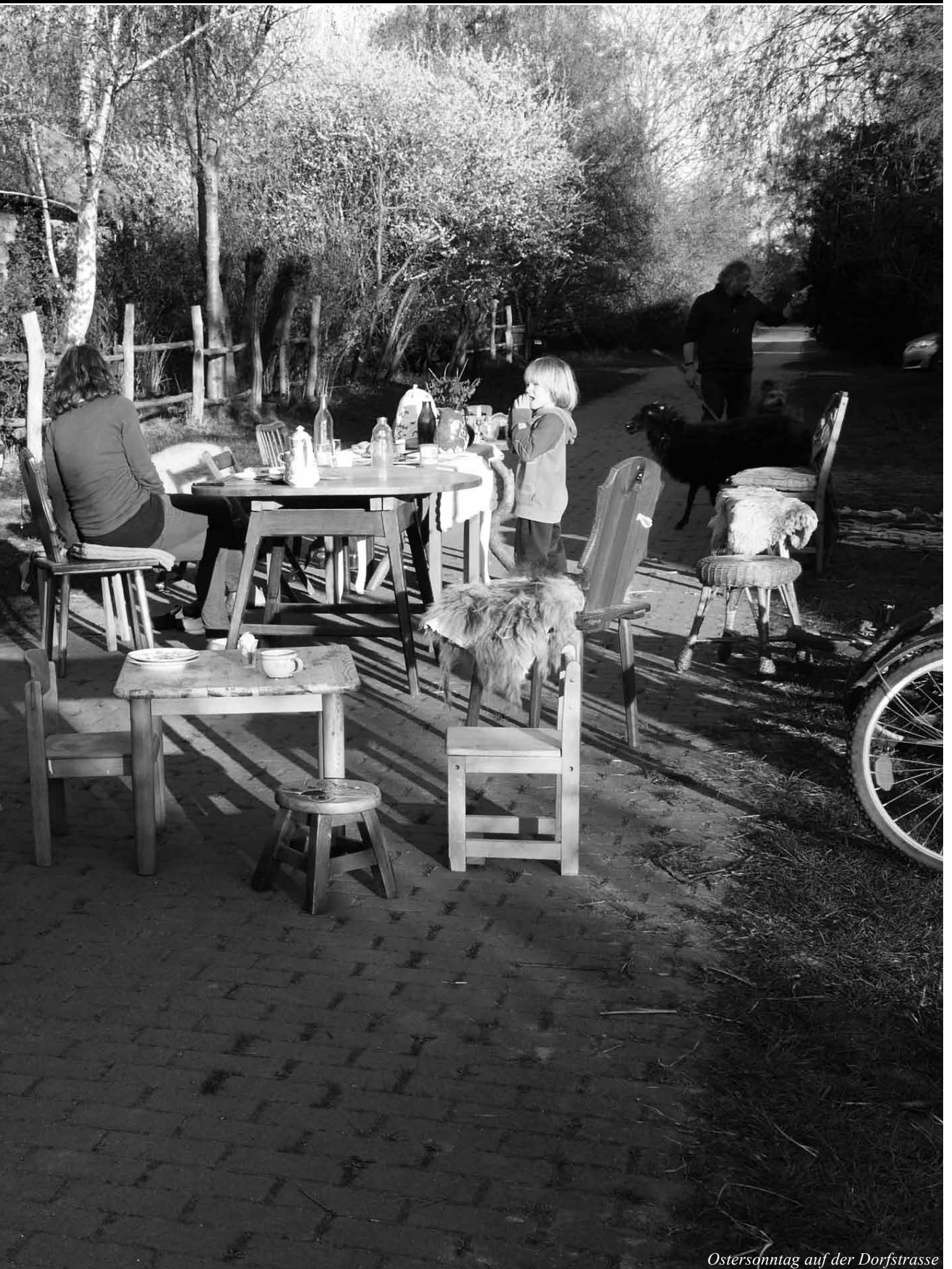
Ostersonntag auf der Dorfstrasse