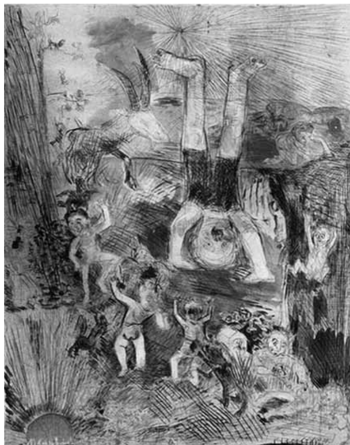
Matthias Jaeger | Ein Bild für die Natur ( Kindheit) | 1992

www.schlossgut-broock.de/veranstaltungen