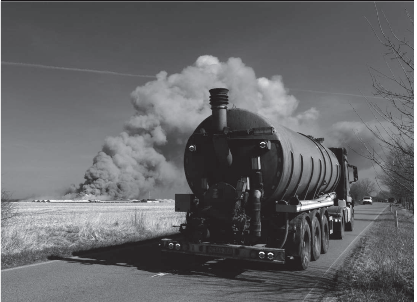
... selbst wenn der Brand nicht mehr zu löschen ist - die produzierte Gülle muss entsorgt werden