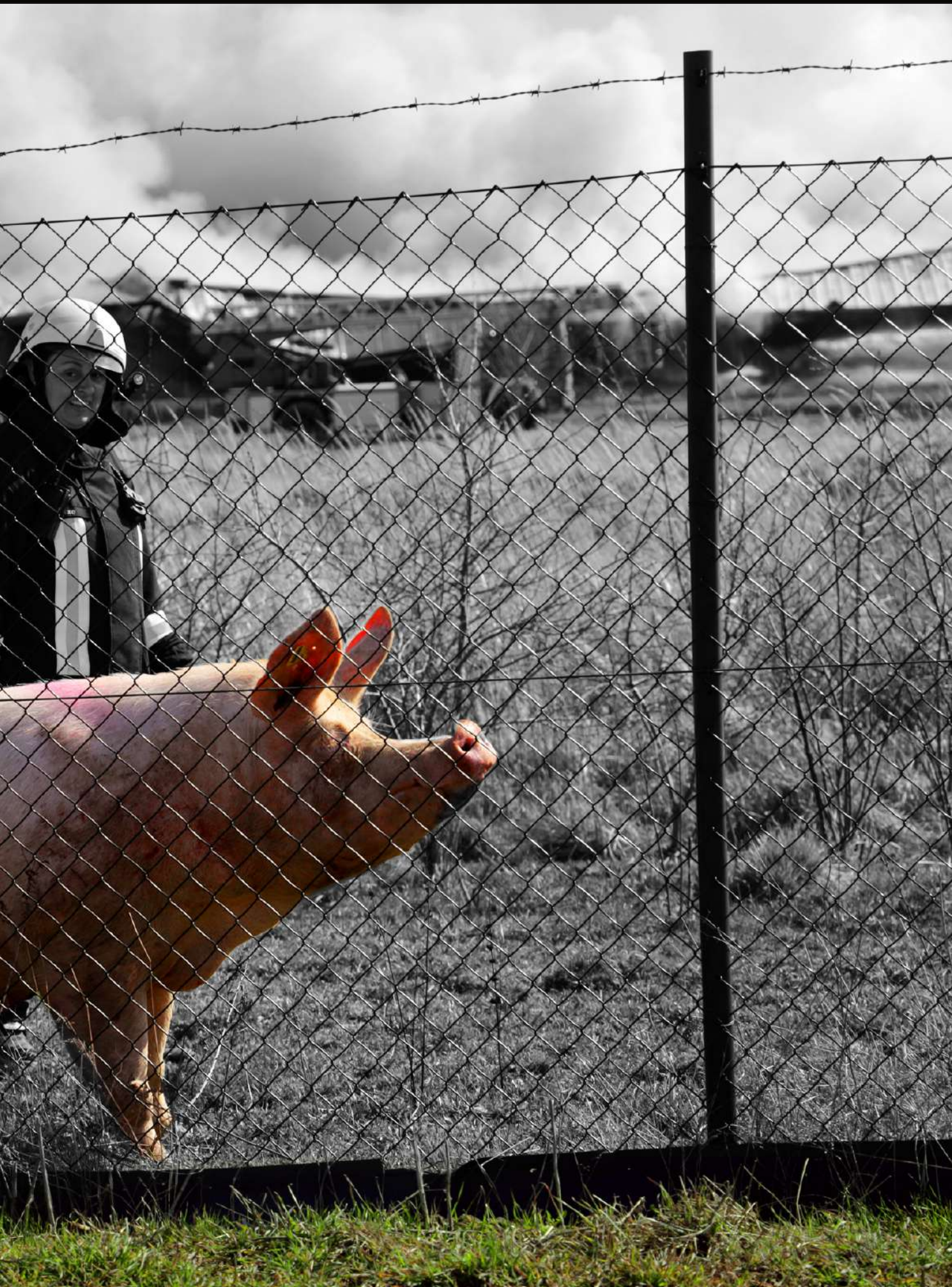
den Namen „Else“ bekommen (zehntausende andere Nummern wurden inzwischen mit schwerer Bergetechnik entsorgt)