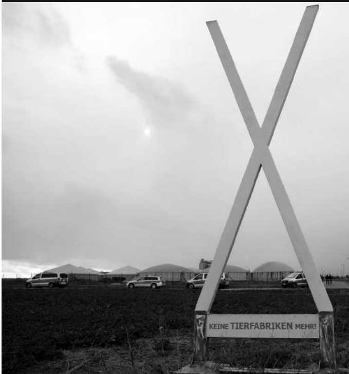
Mahnwache geht weiter - erster Montag danach: 5. April 2021