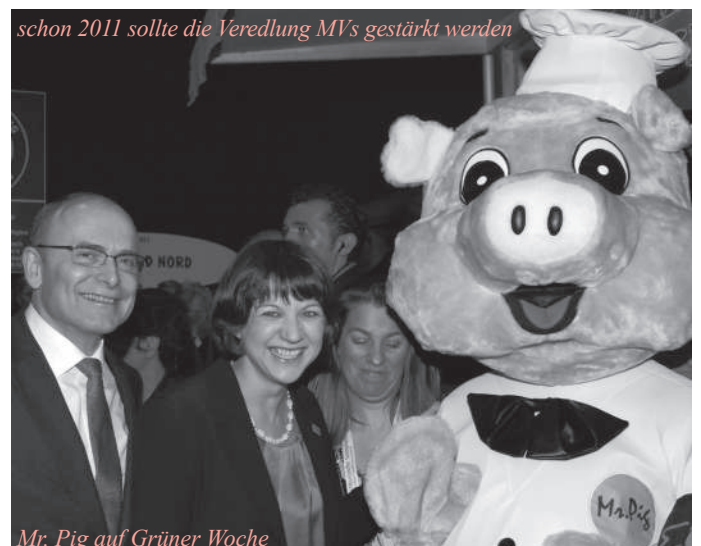
Mr. Pig auf Grüner Woche