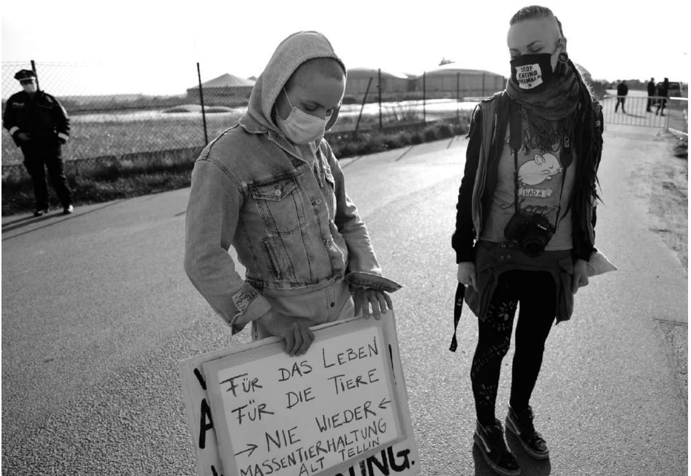
Die Mahnwache geht weiter - Gemeinsam ein Zeichen gegen Massentierhaltung in Alt Tellin und überall, Montag 19.4.2021