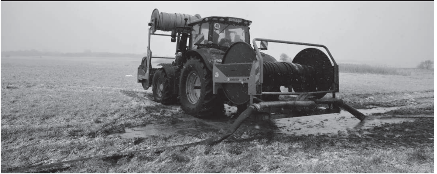
Gülleausbringung am 5. April 2021 mittels Rohrleitung ins Tollensetal