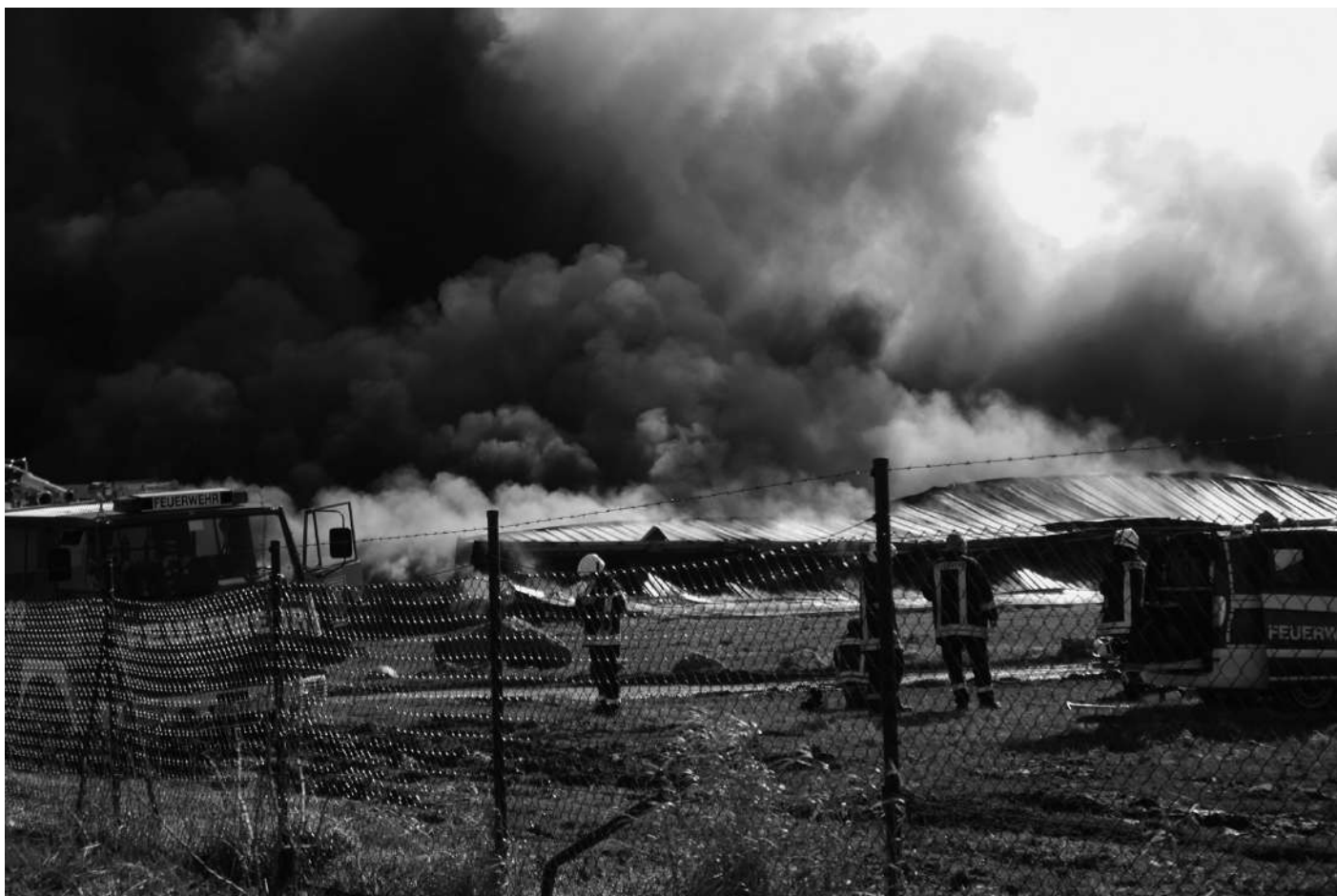
Feuerwehren und Rettungskräfte aus der gesamten Region konnten die Tiere nicht retten