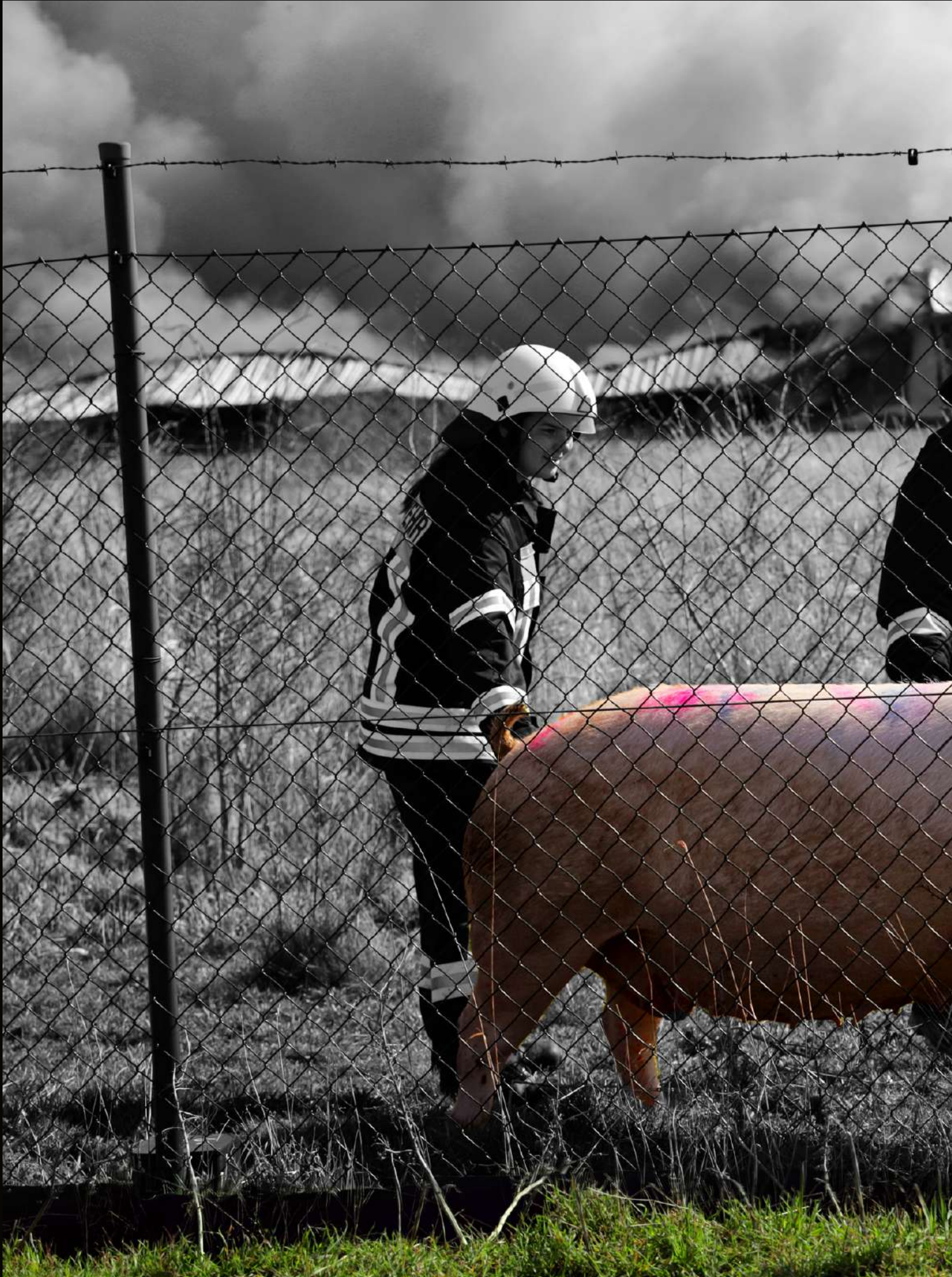
Aus Nummer 38.958 wurde am 30. März 2021 ein wirkliches Glücksschwein - von den Frauen der FFW Alt Tellin hat es