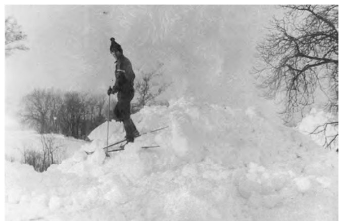
Foto: Sohn Harald Klim unterwegs zur Schule nach Alt Tellin Jan.1979