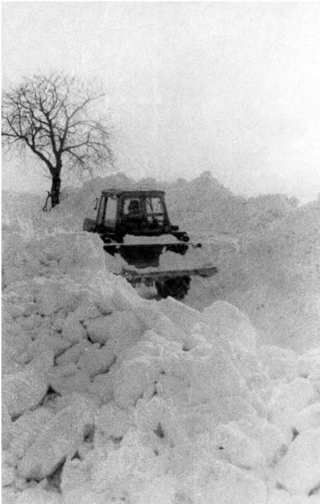
Foto: Winterdienst zw. Neu Buchholz u. Hohenbüssow 1979

Als Hohenbüssow eingeschneit war... Alle zehn bis elf Winter dasselbe Schauspiel: nichts geht mehr. Ein Schneewinter, wie er im Buche steht! Auch in diesem Jahr türmten sich die Schneewehen und Hohenbüssow war tagelang eingeschneit. Kein Schulbus fuhr mehr, kein Erwachsener kam durch zur Arbeit. Die Kinder freuten sich und tobten im Schnee und den Leuten boten sich imposante Naturschauspiele, nicht weit vor ihrer Haustür. Viele pilgerten zu den bizarren Schneedünen, die sich meterhoch auftürmten auf dem Weg nach Golchen. Erst nach Tagen schafften es Radlader, die festen Schneemassen beiseite zu baggern, und der Weg war wieder frei.