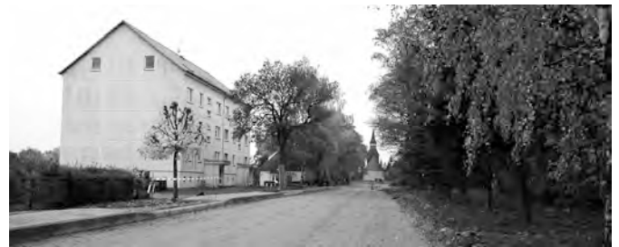
Der Kreisstraßenneubau nähert sich stetig seinem Abschluss.

wurde durch Vandalismus zerstört. Unsere Gemeinde wurde bereits darauf hingewiesen, dass Sie auf Grund der Zweckbindungsfrist verpflichtet ist, eine neue Rasthütte zu errichten oder die gezahlten Fördergelder zurückzugeben. Laut Aussage der Gemeinde ist es geplant, einen neuen Standort zu finden, der zukünftige Vandalismusschäden ausschließt.