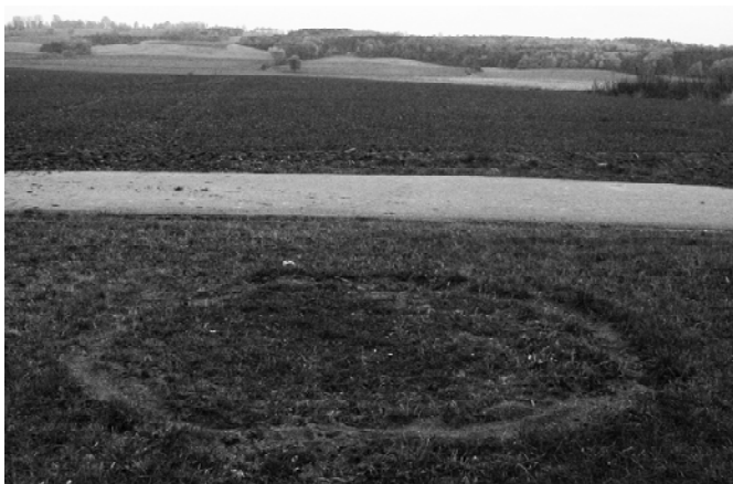
Die Rasthütte in Neu Tellin (LEADER-Maßnahme 2008)

Im September berichtete der Anzeigenkurier über 3500 Jahre alte Skelettreste von Bronzezeitmenschen, die bei Welzin am Ufer der Tollense gefunden wurden. In dem gut besuchten Video-Vortrag „Es hört nicht auf“ auf der Burg Klempenow am 16. Oktober erläuterte der Archäologe Jens Ulrich sehr anschaulich bisherige archäologische Funde aus dem Tollensetal. Einige ausgestellte Keramik und Bronzegegenstände aus dieser Zeit wurden von den Betrachtern wegen ihrer handwerklichen Leistung nachdenklich bewundert. Viele gefundene Schädelknochen weisen Spuren von Gewaltanwendung auf. Inwieweit es sich im Tollensetal um ein bronzezeitliches Siedlungsgebiet, ein Schlachtfeld oder beides handelt war bisher noch nicht ausreichend zu klären. Aus finanziellen Gründen konnte die archäologische Forschung bisher leider noch keine systematische Untersuchung vornehmen, sondern meist nur auf zufällige Funde vor allem an Baustellen reagieren. Dabei verdient die große Unterstützung freiwilliger Helfer Erwähnung. Ohne sie wäre selbst die bisherige Arbeit nicht zu leisten gewesen. Unser Tal und der Grund der Tollense bergen also noch viele Geheimnisse. Wir sollten sehr aufmerksam und behutsam mit unserer Landschaft umgehen und uns unserer bewegten Vorgeschichte würdig erweisen.