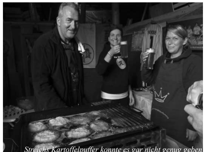
Streichs Kartoffelpuffer konnte es gar nicht genug geben