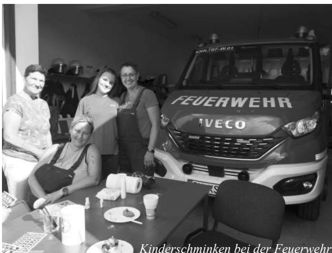
Kinderschminken bei der Feuerwehr

Die Offene Töpferei Löber in Neu Tellin gut besucht, Feuerwehr-Hüpfburg vor der Storchenbar in Alt Tellin, volles Haus bei der Blaskapelle „Tollensetaler“, Festgottesdienst in Hohenbüssow, alle Plätze besetzt - wie zu Weihnachten, bei Streichs in Neu-Buchholz - Festbier zur lange Schlange bei den Puffern, Harfenklänge in Siedenbüssow, dem „Sahnestückchen der Gemeinde“, dazu Grillwurst von der Feuerwehr... Ach ja, und der Live Act Key Katcher lockte nicht nur die Jüngeren zur Party in die Broocker Reithalle. Angebote, Angebote...: 29. APPELMARKT auf Burg Klempenow am 1.10. ab 10 Uhr 15. APFELFEST in Hohenbüssow am 15.10. ab 13 Uhr ab Vormittag Mosttermine, bitte anmelden: 0176 20454960