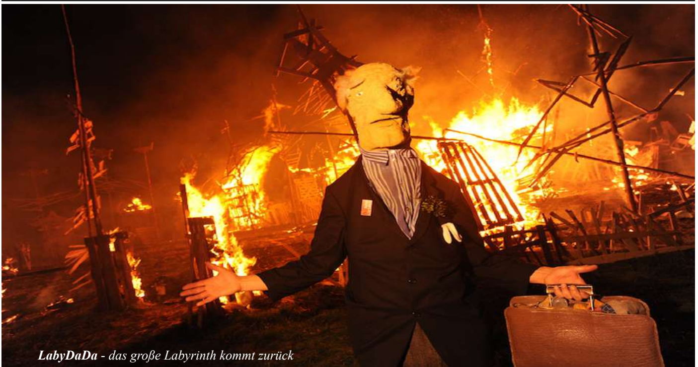
LabyDaDa - das große Labyrinth kommt zurück