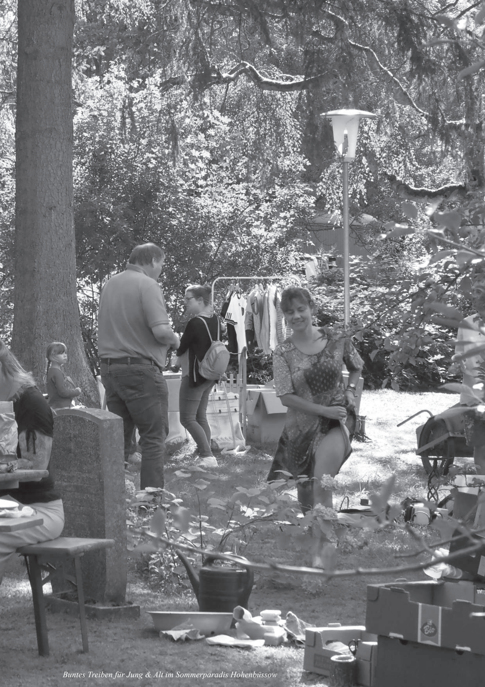
Buntes Treiben für Jung & Alt im Sommerparadis Hohenbüssow