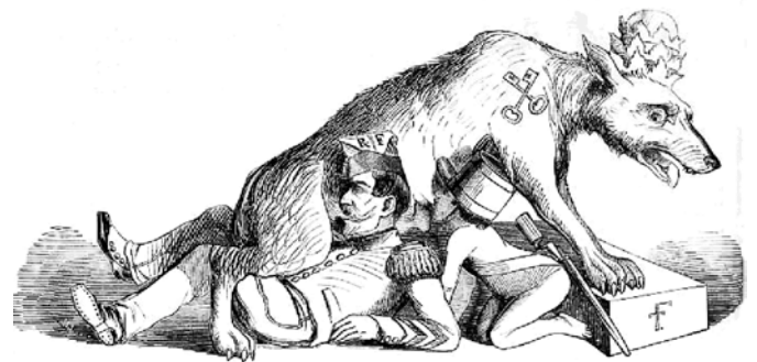
Romulus und Remus, von der Wölfin gesaugt. (Historisches Bild 1851)