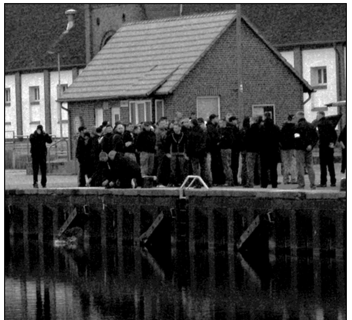
Traditionell Kranzabwurf der Neonazis in der Hansestadt DM Alle Jahre wieder?