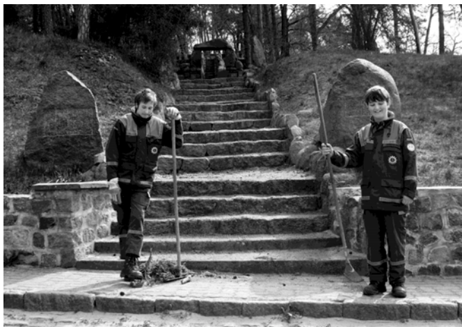
Technische Hilfe beim Frühjahrsputzen am Kriegerdenkmal