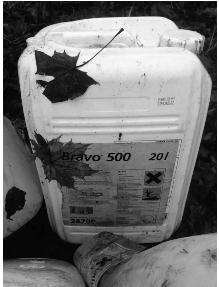
was doch am Ackerrand so alles zu finden ist...