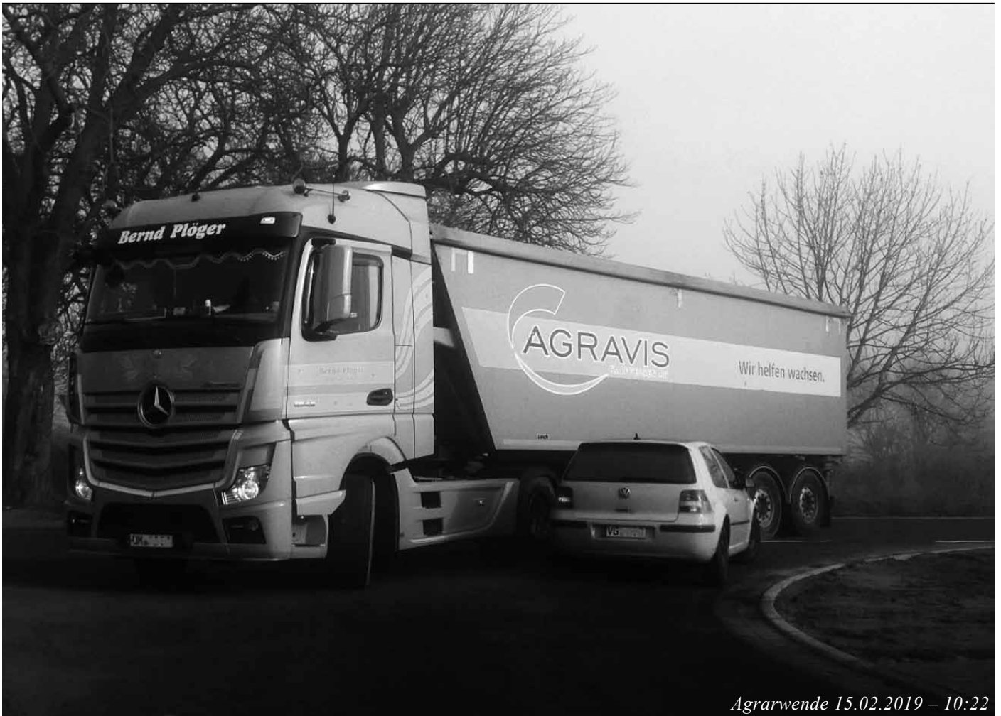
Agrarwende 15.02.2019 – 10:22