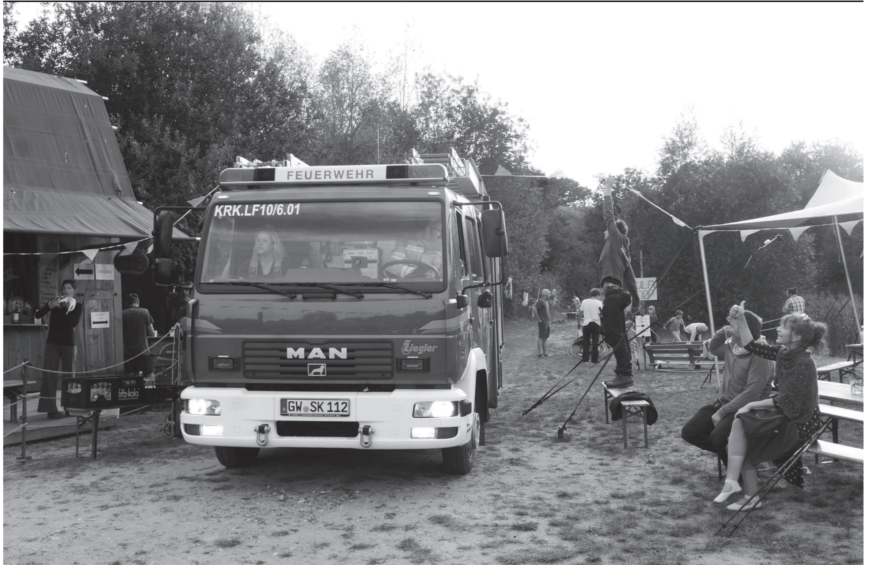
Technische Hilfe für die Feuerwehr auf dem Freiland-Kinderfest am 12. September in der Kieskuhle Broock