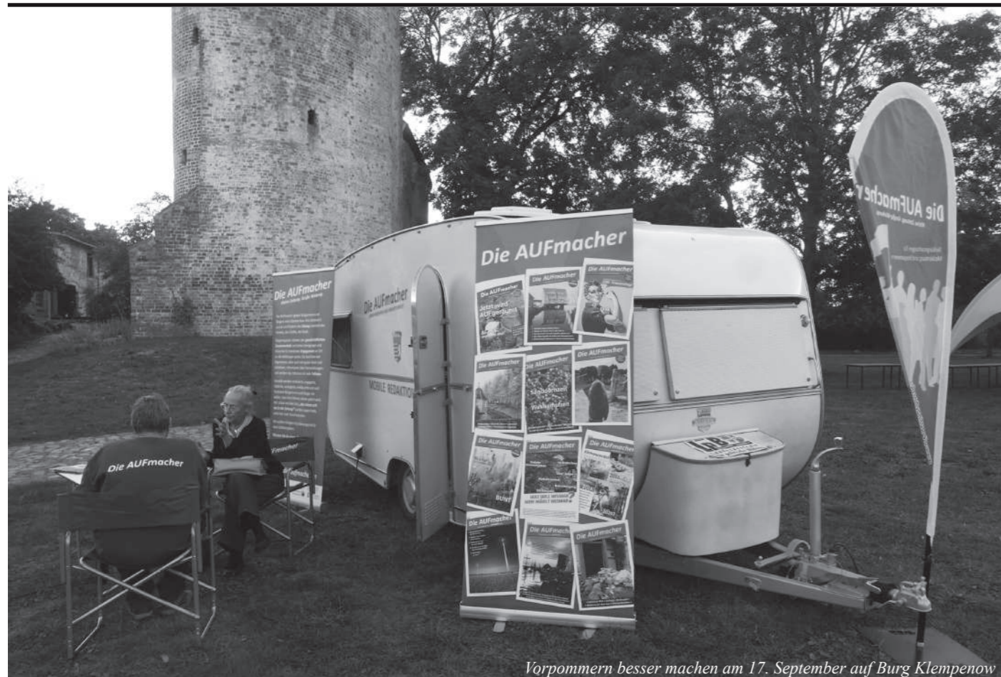
Vorpommern besser machen am 17. September auf Burg Klempenow

„Die AUFmacher“ - die Bürgerzeitung gibt es seit 2011 nur für Mecklenburg - in Vorpommern gibt es seit 2009 die „Tollensetaler Stimme“