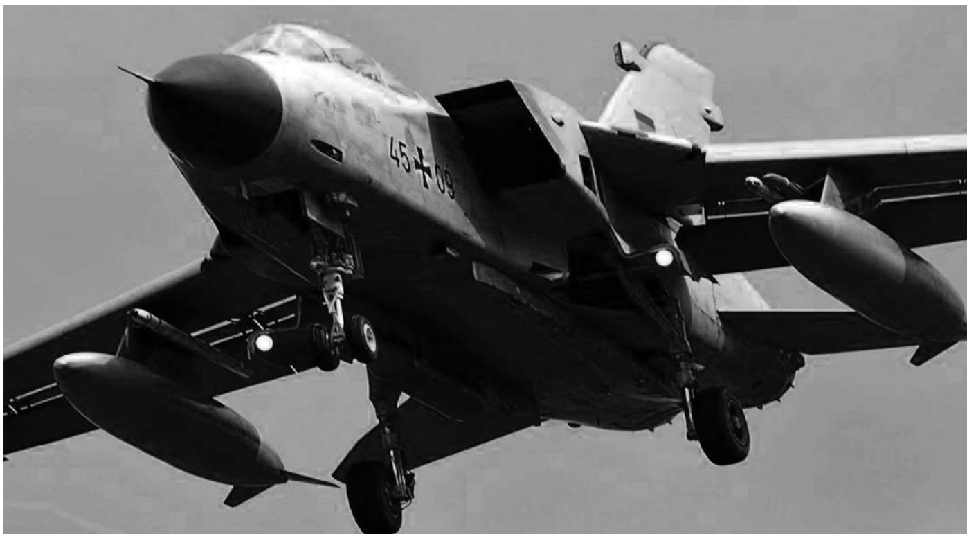
Tiefstflieger-Tornados am 24.9. auch über dem Tollensetal